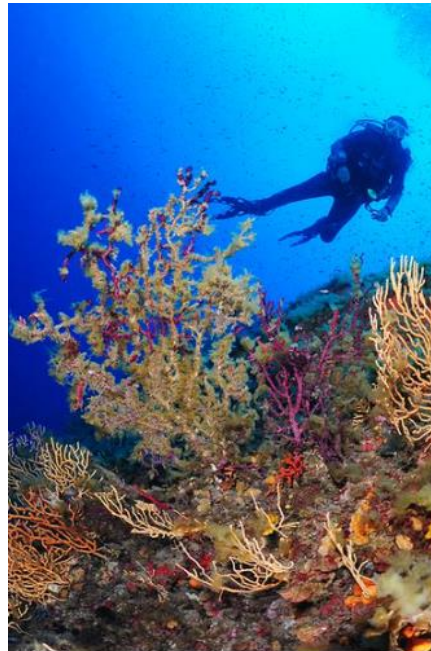
La Pierre à Sika Superbe roche de 20 à 45 mètres en forme de haricot habitée par une famille de mérous bruns