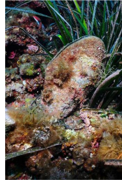
Grande Nacre de Méditerranée