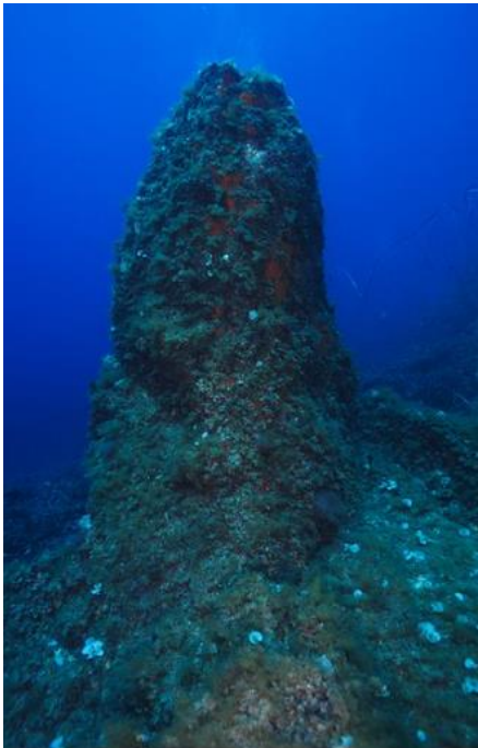
Les Pyramides Succession de secs rocheux entre 3 et 45 mètres.