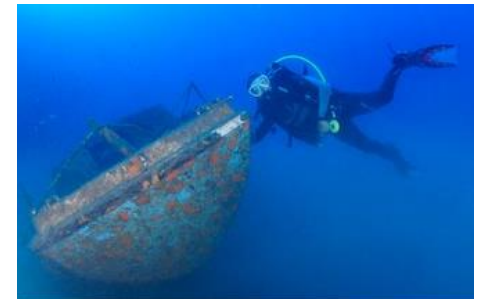
Une petite épave sur le côté Ouest du Lion de Mer