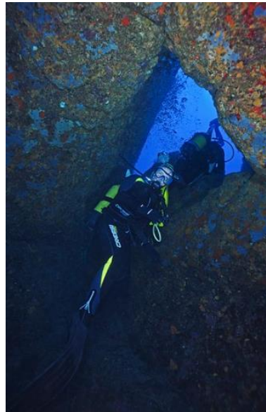
La Roche percée Magnifique roche trouée, on peut la traverser, accessible au niveau 1