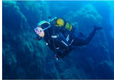
Le Sec des Cigales 2 Roches entre 3 et 36 mètres avec une magnifique faille tapissée de faune