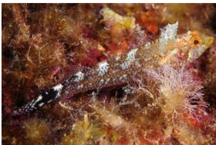
Triptérygion sur tous les sites