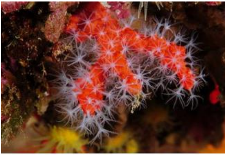
La grotte à Corail Entre 24 et 36 mètres de profondeur, ses parois sont tapissées par le Corail Rouge de Méditerranée