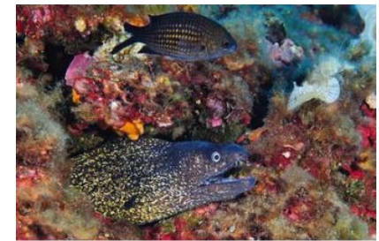
La Vitrine Entre 20 et 40 mètres quelques murènes et son banc de barracudas à son sommet