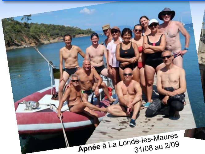
Apnée à La Londe-les-Maures 31/08 au 2/09