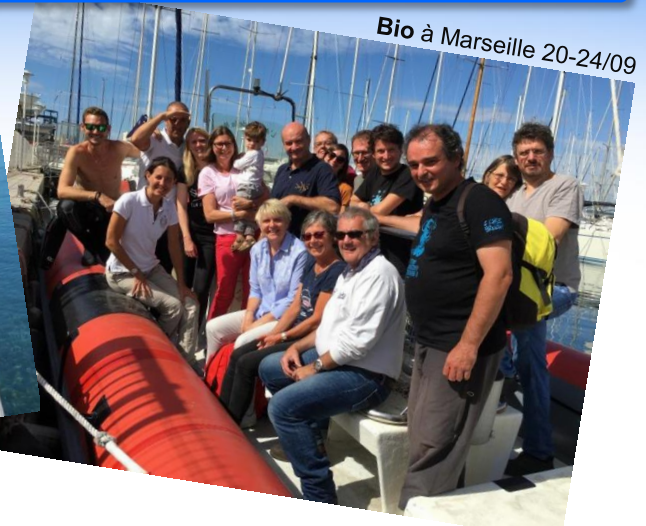
Bio à Marseille 20-24/09